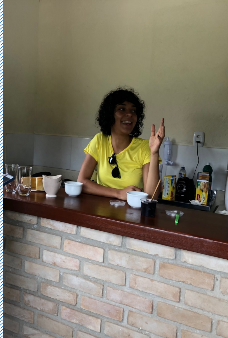
Fazenda de Açaí Bom Sossego, Porto Seguro/BA Instagram @fazendabomsossego Projeto Airbnb Experiences