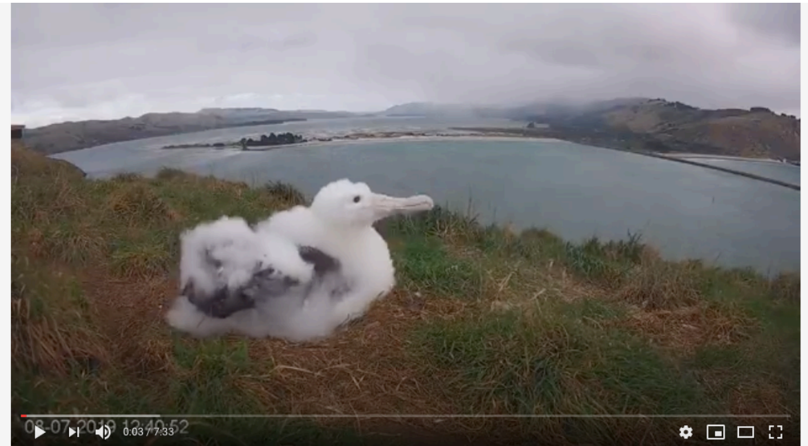
Royal Cam highlight 2019: parent visit 8 July