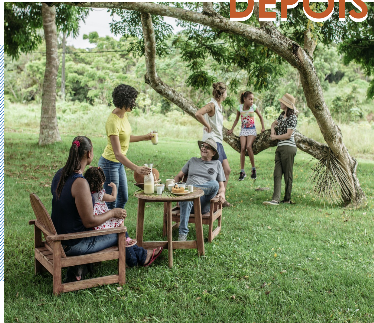
Fazenda de Açaí Bom Sossego, Porto Seguro/BA Instagram @fazendabomsossego Projeto Airbnb Experiences