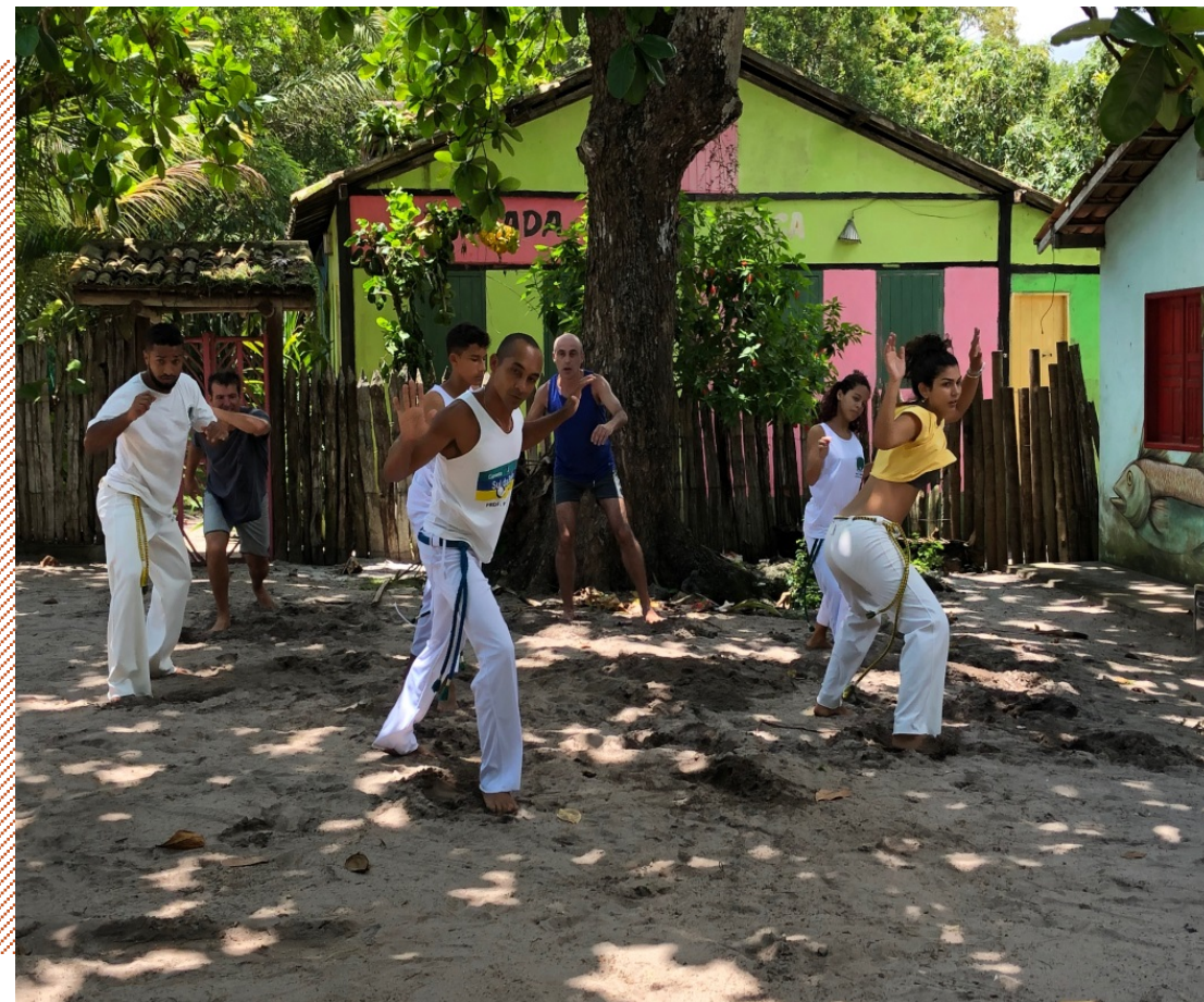
Associação dos Nativos de Caraíva / BA Projeto Airbnb Experiences