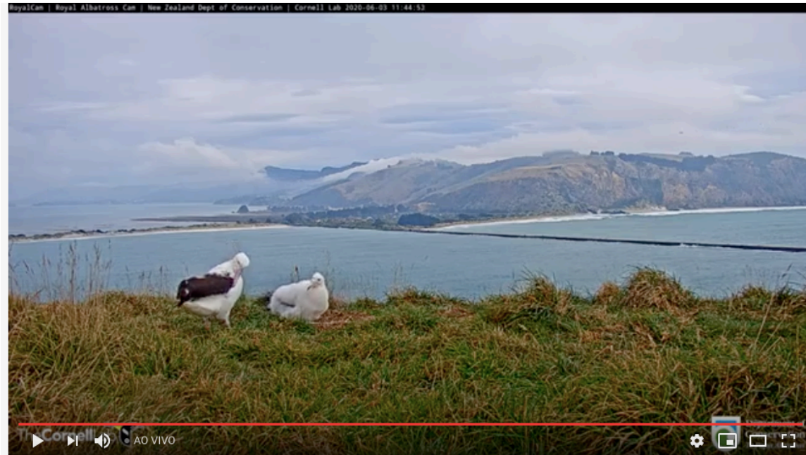
Live Royal Albatross Cam - #RoyalCam - New Zealand Dept. of Conservation | Cornell Lab

Exemplo: câmeras ao vivo para transmissão de natureza (Youtube, Instagram, etc).